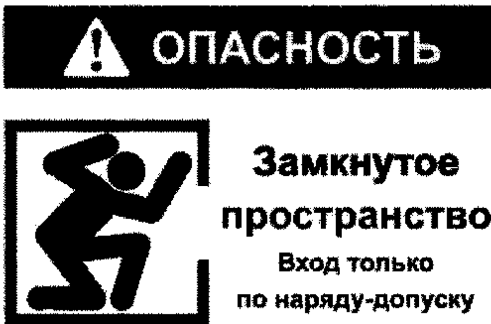
Рекомендуемый знак "ОЗП"

2. Объекты, вошедшие в Перечень 1 и не являющиеся территориально обособленными объектами, должны быть обозначены знаком "ОЗП" (рекомендуемый текст).